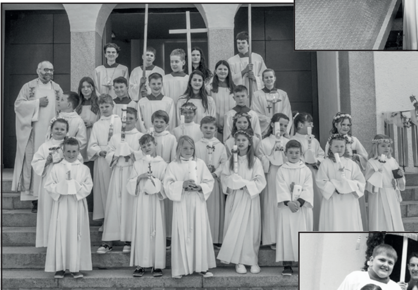
Erstkommunion Kressbronn