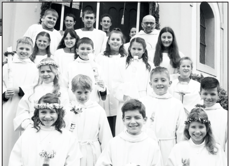
Erstkommunion Gattgau