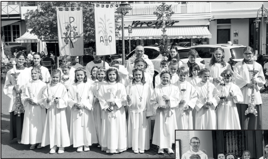
Erstkommunion Langenargen / Oberdorf