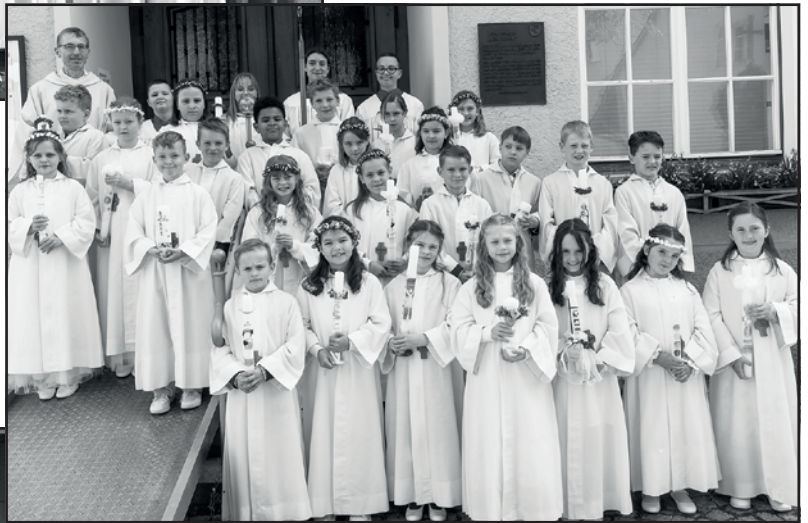
Erstkommunion Eriskirch / Mariabrunn