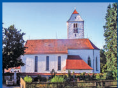
St. Dionysius Hiltens- weiler