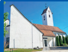
St. Maria Rosen- kranzkönigin Neukirch

Das Pfarrbüro Neukirch ist am Freitag, 13. und Dienstag, 17. Februar geschlossen.