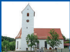
St. Martin Gopperts- weiler