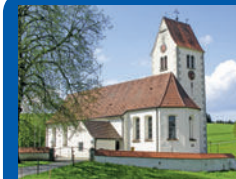
St. Georg Wildpolts- weiler

Herzlichen Dank für die vielen Handys die bei uns eingegangen sind. Die Aktion endet nun am 31. Januar. Danach bitte keine Handys mehr abgeben!