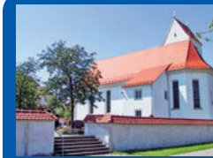
St. Martin Tannau