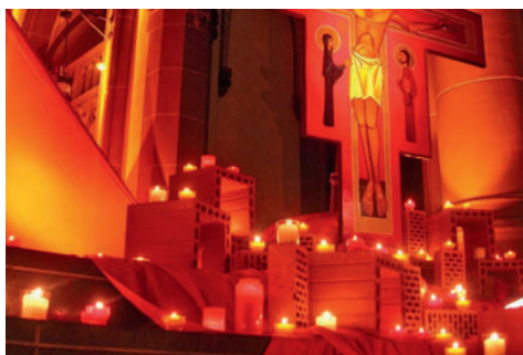
Taizé-Gebet Sonntag, 01. Februar um 18 Uhr Kirche Laimnau musikalisch begleitet von Bright Light