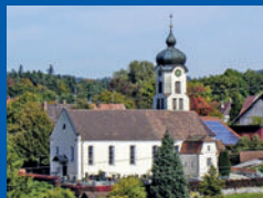
St. Georg Krumbach

Am 14. Februar gedenkt die Kirche des heiligen Valentin von Terni, dem Patron der Liebenden. Aus diesem Grund wird an diesem Tag auch der Valentinstag gefeiert.