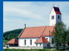
St. Margaretha Obereisen- bach