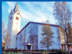
St. Peter und Paul Laimnau