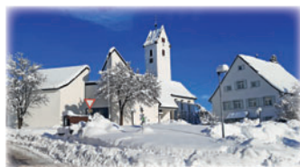
Kirche Neukirch Januar 2021