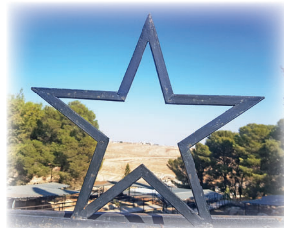
Stern auf dem Hirtenfeld (Westjordanland) mit Blick auf Bethlehem