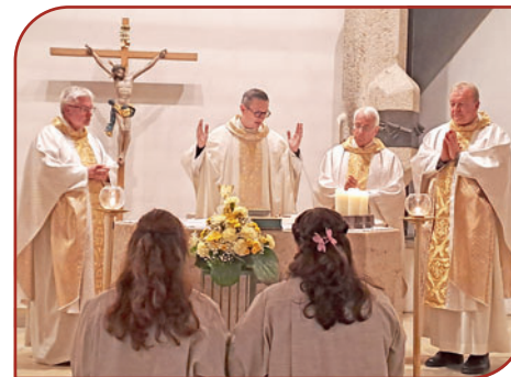
25 Jahre Seelsorgeeinheit Argental 10. Oktober