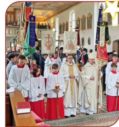
750 Jahre Krumbach am 5. Oktober

Große Veränderungen stehen uns bevor. Die Diözese hat unter dem Titel „Kirche der Zukunft“ mehrere Prozesse aufgelegt, die das Aussehen und die Strukturen unserer Pfarrgemeinden tiefgreifend verändern werden. Dies wird auch auf die Seelsorge Einfluss haben.