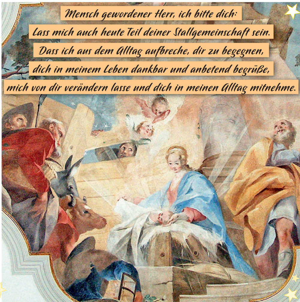
Deckengemälde Jesus Geburt in Laimnau in der Marienkapelle. 1780 Andreas Brugger aus Kressbronn

mich von dir verändern lasse und dich in meinen Alltag mitnehme.