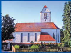
St. Dionysius Hiltens- weiler